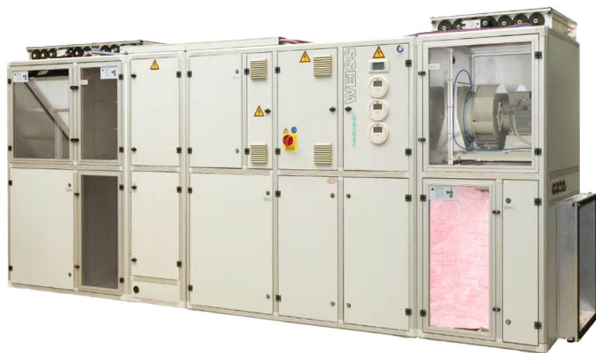
Kompaktowa szafa klimatyzacyjna Mediclean w wykonaniu higienicznym Weiss Klimatechnik

Pierwszą z nich jest funkcja filtracji poprzez zastosowanie odpowiedniej klasy filtrów (H13-H14). Przy czym decydują-