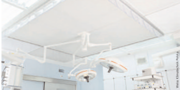
Weiss Klimatechnik Polska

„ W Polsce nikt nie weryfikuje laminarnego przepływu strumienia powietrza, który jest jedynym gwarantem wyeliminowania źródła zakażenia z obszaru pola operacyjnego „